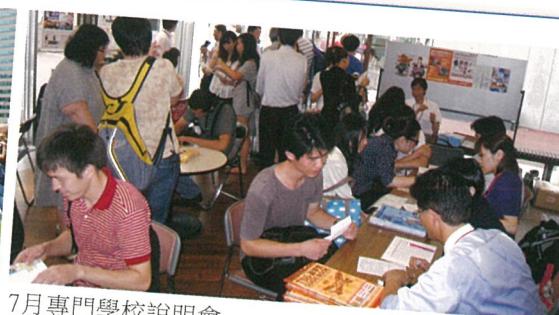
7月專門學校説明會